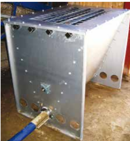
Mineralstoffdosierer OMD380 mit zusätzlichem Paddel zum Zerschlagen eventueller Futterbrücken.