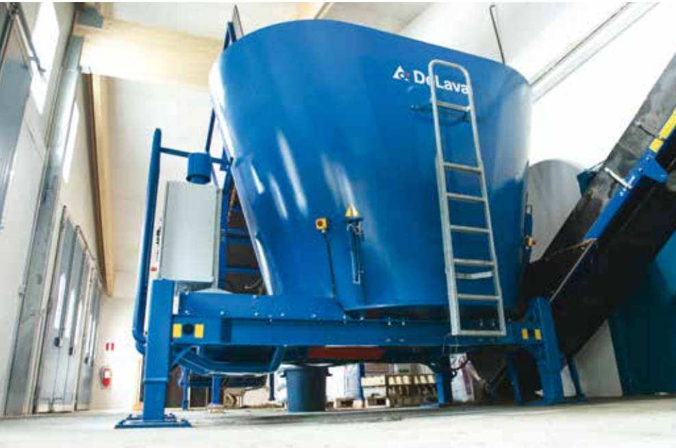
Vertikaler Stationärmischer VSM mit Förderband

Die Mischer lassen sich mit Umschaltgetrieben ausrüsten, die beim Entladen in einen Selbstreinigungsmodus umschalten. Sie können mit bis zu zwei Entnahmetüren ausgestattet sein – zum Beispiel eine automatisch angesteuerte und eine zweite mit manueller Steuerung für die Befüllung eines Verteilwagens für ein anderes Gebäude. Die 8 bis 12 m³ Versionen passen ideal zum Optimat™ Master System, die größeren Mischer finden Verwendung, wenn keine Pufferlager vorhanden sind und die Tagesration im Mischer Platz finden soll. Vertikale Stationärmischer sind in Größen von 8 bis 22 m³ mit frequenzgesteuerten Motoren von 30 bzw. 37 kW verfügbar.