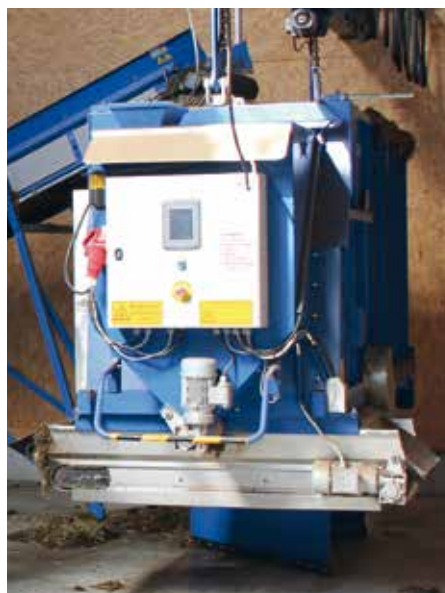
Futterwagen ORW mit Förderband