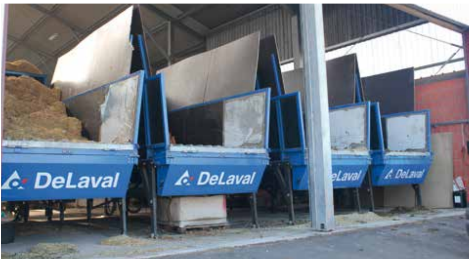
DeLaval ORB1000 Befülltische in horizontaler Position