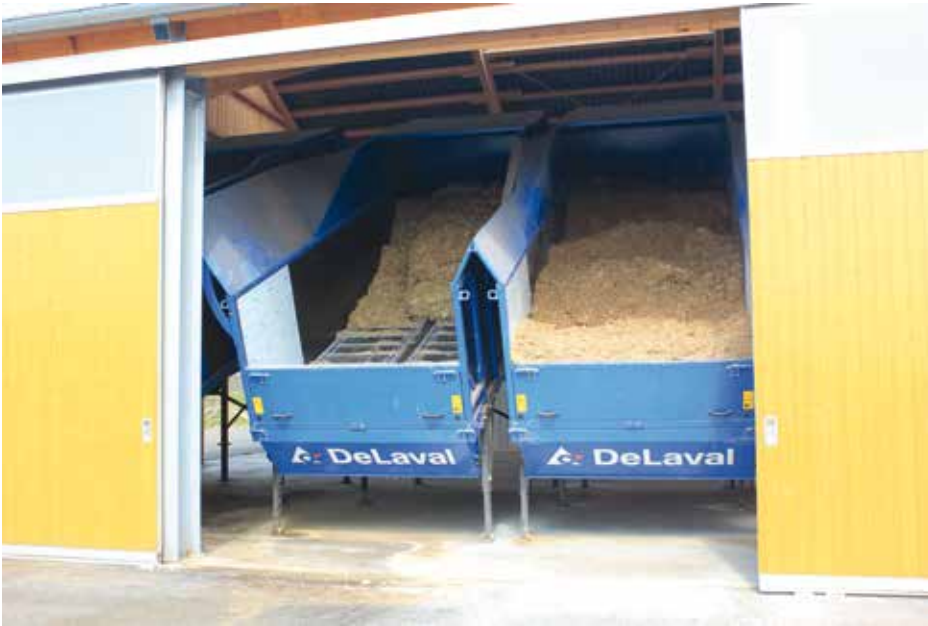
DeLaval Befülltisch ORB1000 hochgestellt